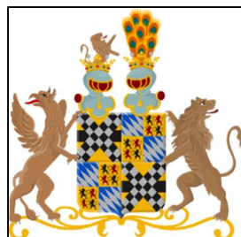
Wapen van familie Van Aerssen Beijeren

Tijdens het afbreken is er dynamiet gebruikt om de middeleeuwse kelders die zo stevig gebouwd waren ze te vernietigen. Hierbij bleek ook dat de fundamente groter waren dan het huis. Er is ook een wapenstein van het geslacht van Aerssen Beijeren gevonden. Het terrein van Huis Meteren is nog steeds als 'vierkant' herkenbaar in het landschap.